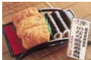
いなり海苔巻寿司 570円(税込)

明治10年創業の老舗店菓子匠「つくし」。このテイクアウトは、しっかりと味付けされた厚めのお揚げに赤酢を使った酢飯のいなり寿司と、たっぷりのかんぴょうと風味の良い海苔が特徴のかんぴょう巻きのセット。これに店内で売られているおでんと一緒に和風なランチはいかが？デザートには名物のプリンやワッフルもある。