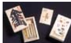
左: 金千両 600円(税別) 右: 干支楊枝 900円(税別) 「毎年人気の干支楊枝。しかし残念ながら今年もすでに完売」