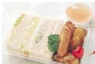
5 ランチBOX 30円(税込)

対面式でオープンな店構えの「ペティスコ」。ここで昼時OLに人気ののが「ランチBOX」。ツナやタマゴが入った4種類のサンドイッチに手作りの惣菜、おまけにデザートまでついてとってもお得！店頭には毎日40種類のパンも並び思わずあれもこれもと買ってしまうかも。最近の一番人気ブルーベリーベーグルも要チェック。