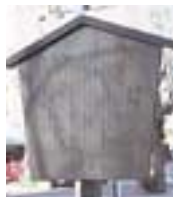
弁慶像の由来が書かれている高札

春は桜が美しいグリーンベルト。その遊歩道の一角に立つ「弁慶像」。厳しい顔に兜巾(ときん)という小さい頭巾を被り、篠懸(すずかけ)を着た「山伏姿」。右手を高々と上げ、その手には勤進帳を、そして左手には数珠を握りしめるといふ、ご存知勤進帳の「弁慶」。傍らにある高札を読むと、人形町は当時、江戸三座といわれた芝居小屋のうち二座があって、歌舞伎を上演して芝居街として栄えていた。人形町界限は今日隆盛を極める江戸歌舞伎発祥の地と呼んでも決して間違いではないだろう。だからこそ、弁慶像がこの街の記念像のひとつとなっているわけ！その芝居街、人形町の伝統を今に伝える明治座は、この遊歩道のすぐ近く。