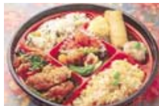
6 上海御膳 80円(税込)

おいしい中華料理がリーズナブルな値段でいただける「王さんの台所」。お昼の一番人気は「上海御膳」。手間がかかるため毎日限定15食。2種類のご飯と、エビチリや春巻きなど7種類のおかずが彩りよく入っており、色々な味を楽しめると女性客に大好評。その他にもボリューム満点のお弁当が数多く店先に並び。