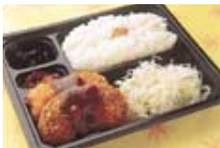
6 コメンチカツとカニクリーム 10 ツケカツ弁当 0円(税込)

100年以上の歴史をもつ今半の味を気軽に味わえる「あったか惣菜」。そこでお勧めの「メンチカツとカニクリームコロッケ弁当」は、和牛を惜しみなく使い玉葱と塩・胡椒のみのシンプルな味付けで作られたメンチカツとまるやかでコクのあるカニクリームコロッケとのコンビ。自家製ソースをかけ熱々をいただきたい！