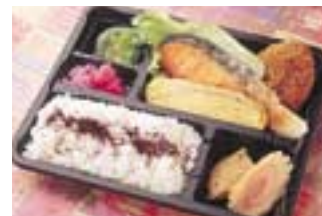
4 鮭弁当 50円(税込)

50年以上前から人形町に店を構える食料品店「わしや」。ここで一番のこだわりはお米！ふっくら炊き上がったごはんは、冷めてもおいしい新潟産のコシヒカリを使用。そこに大きな鮭と卵焼き、ボリューム満点のメンチカツが入った「鮭弁当」は男女問わず人気。他にも20種類前後の手作り弁当が並び、きっと選ぶのに一苦労。