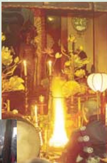
平成16年1月17日に行われた護摩祈祷

の祈祷を行う。だから地元に住んでいる人を初め、人形町で働いている人、遊びに来る人たちが立ち寄り、人形町で一つしかない貴重なお寺なのである。境内には本堂の他、馬頭観音、章駄天尊、願いの地藏尊などが祀られている。特に願いの地藏尊には、左右にお札がたくさん貼っており、裏にはお願い事が書かれている。