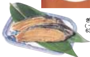
ぎんだら京粕漬 (一切) 630円(税別)

ここ魚久は、あの向田邦子に「人形町へ来て魚久へ寄らないのは片手落ちであろう」と言わしめた京粕漬の名店。常にお客さんと賑わっているその店頭の暖簾に愛らしい丸みのある魚を発見。このロゴマークは、15年ほど前、現在の3代目ご主人がデザインしたもので、「魚」をイメージした絵柄と「久」という文字、それに周りを囲む円は従業員の「和」を意味するという。なるほど—もう一度暖簾を眺めて納得！そして店内に入れば豊富な種類の粕漬がショーケースに並び、その中でも一番人気と言えば「ぎんだら京粕漬」だ。しっかりと漬け込まれた粕を洗い流し焼くのだが、香りや旨みはそこなわずに美味しいわけは、やはり魚久秘伝の味だからなのか。一度食べると忘れられない！