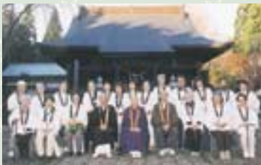
H15.11月に実施された「最上(山形)三十三観音」巡礼(作家 天台寺住職 瀬戸内寂暁師と共に)

その人形町生まれ、人形町育ちの、住職の最初のお役目は、なんと境内の改修工事だった。 「昨年3月にお預かりして、4月の花祭りの時に雨漏りが始まり、本格的に工事を開始したのが秋頃でした。まだ就任したばかりなのに、商店街の皆様初め、地元の人