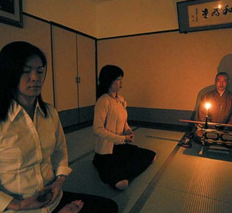
あかりはロウソクの炎のみで、集中!

座禅においては、呼吸法が最も大切。鼻からの腹式呼吸を心掛け、集中し、心静かに保つ。でも集中しようと思っているうちは、まだまだきつとダメなのだろう。周囲が多少気になるし、足はしびれてくるし、姿勢も気になるし...。いつ打たれるのか、ドキドキもの。住職の「休んでください」の声が掛かり、ホッと、休憩に。聞くと、座禅初体験の私たちはなんと5分しか座っていないという。数回繰り返すうちに、自分の呼吸が整っていくのが分かる。すると、余計な考えがふと消え去り、頭と心が真っ白に。 緊張感とともに足の組みを解き、座禅が終了した。精神集中って、けっこう気持ちいいかも。そう普段には感じられない、5分の重み、あの緊張感が今では妙にいとおしくさえ思えるのだから。