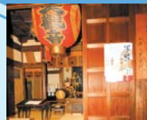
大観音寺本堂入口

だからこそ、前向きな息抜きが必要なんだと思う。いま写経に座禅と、お寺で精神修行が流行っているという。今回は人形町の大観音寺で、写経と座禅を体験。そう、お寺で心と身体をすっきりリセットしてみよう!