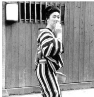
「湯上がり」昭和29年7月4日

のお座敷で、ご披露する踊りの手を復習しながら、仕方振り、よろしく、稽古帰りの道を歩く姿は、花柳界ならではのものです。