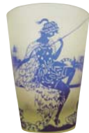
江戸切子人形飾り ● Glass ワタベ