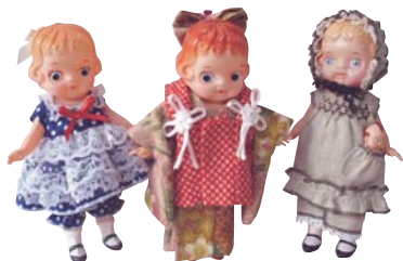
セルロイド人形 ● セルロイド・ドリーム