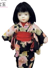
文化人形・ピスクドール ● アートマスターズスクール