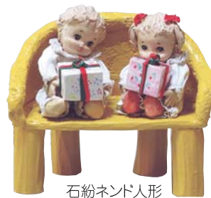
石紛ネンド人形 ● ファンタジックメルヘンドール