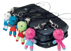
エスニック人形 ● Little JJ