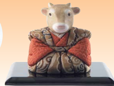
日本人形・干支人形 ● 人形師 原 考洲