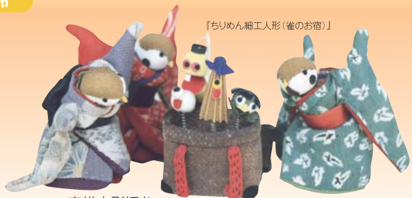
【ちりめん細工人形(雀のお宿)】