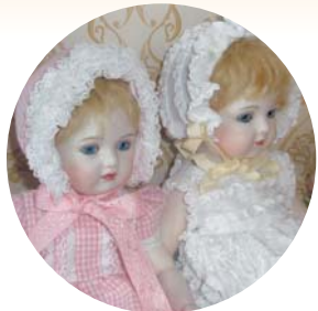
創作ビスクドール ● 早乙女 綾子