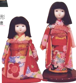
ちりめん人形 ● 祐馬工芸