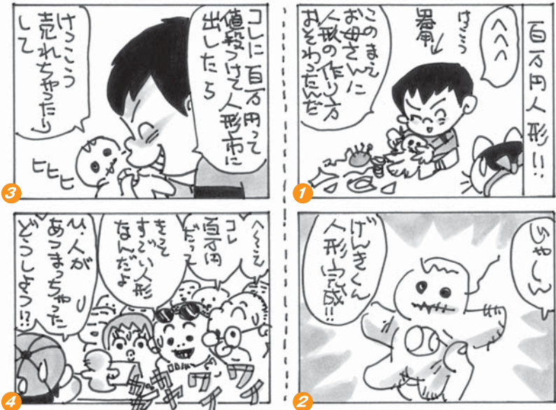
Presented by SANGO MORIMOTO

人形町1-16-10 TEL:03-5614-5305 ●営業時間 平日11:30~15:00 17:30~23:00(22:00 L.O) 土曜・日曜・祝日11:30~23:00(22:00 L.O) ●無休