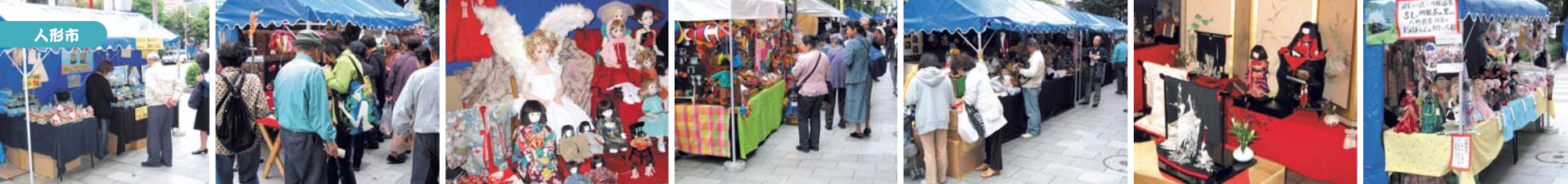
▲昨年行われた人形市の模様