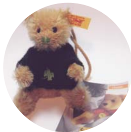
フェイラー製品・シュタイフ製品 ● 山本商店