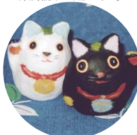
京都 賀茂川人形 ● 人形町 松ざわ