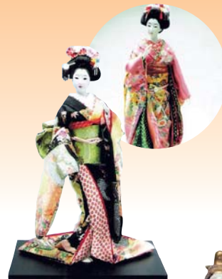
木目込人形・衣裳人形 ● 人形美術協会

アンティークドールから和洋人形、粘土人形から創作人形まで、その表情、動きから、人形たちの言葉を感ずて。