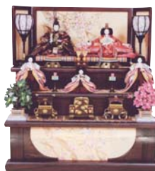
雛人形ほか ● 会春人形店