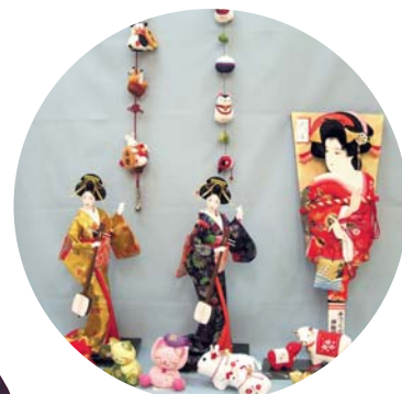
日本人形・干支・民芸 ● 人形の一藤 いち藤