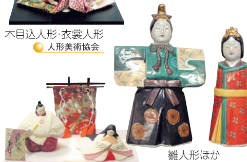
雛人形ほか ● 食器卸 ペル