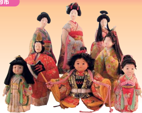
雛人形、木目込人形 ● 宝玉