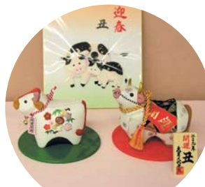
日本人形ほか ● 久月