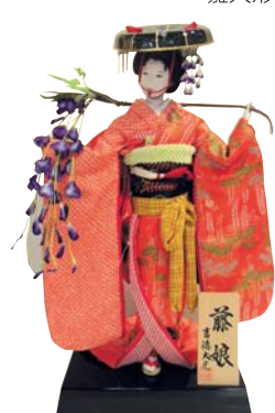
日本人形 三月人形・五月人形 ● 吉徳

「人形市」でお気に入りの人形を見つけて！ ここには、様々な人形との出会いがあります。