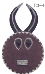
【コートシポアル製 バウ族 プレブル仮面】