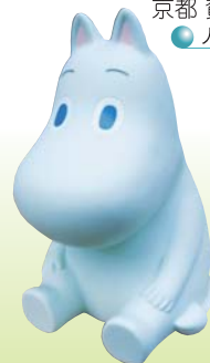
人形・アクションフィギュア ● 久保商店