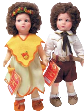
和人形・西洋人形 ● セサミプレインズ