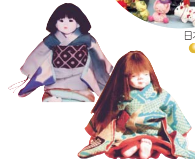
手作り人形 ● 人形屋 りゅう