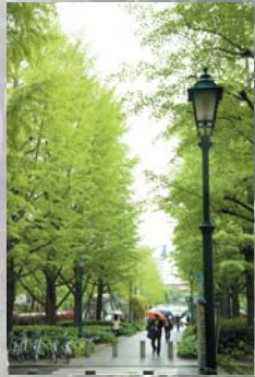
「浜町の新緑」 緑が気持ちいい、緑道