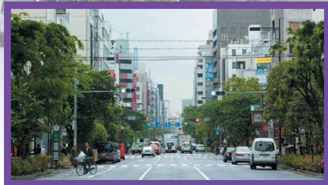
「人形町通り」ドラマは、ここから始まる。