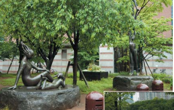
「浜町公園」 犬の散歩に使われた舞台 「浜町公園」は、中央区の 公園の中で最大の面積を誇る。