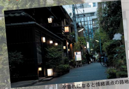
夕暮れになると情緒満点の路地