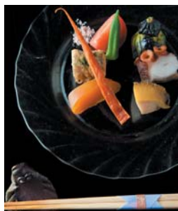
毎日、瀬戸内海から、夜漁場で捕れた新鮮な魚が早朝届く。だからお料理はおまかせコース。

高きや明かり、窓もお客様が座った位置に合わせて計算。だからこそ、寛げて、心落ち着く空間なのである。