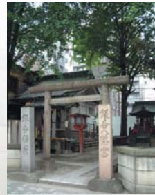
「銀杏八幡宮」 新大橋通りに面した八幡宮。ドラマのロケ 地でもあります。秋にはいちようが紅葉して、 きれい！