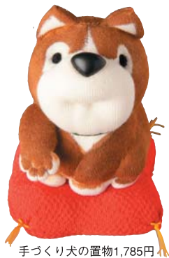
手づくり犬の置物1,785円 「幸せお手犬」