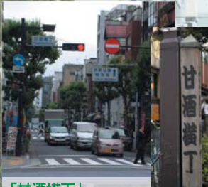
「甘酒横丁」 たびたびドラマに登場してくる、人形町の有名な通り