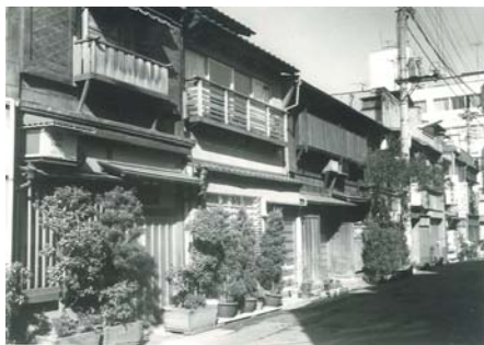
よし町花柳界(むり)の家並 昭和51年頃の人形町(二丁目裏通り)

TBSテレビの日曜日、夜の9時から放送の連続ドラマ「新参者」は人形町から、甘酒横丁、浜町、蛸殻町、小伝馬町と日本橋の名の知れた場所が舞台になっております。人形町の人達や、日本橋周辺にお勤めの方々から、そのご家族までが見られている、テレビドラマはめったにないと評判になっております。実在されているお店をはじめ、何時も歩いている道が毎回出てきて、店の前や、店の中での客とのやりとりの芝居がうつつし出されておき、これらが数日前に見たロケの風景というのですから、少な