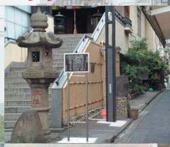
人形町らしい通り。階段上には大観音寺。 ここもロケ地に使われている。