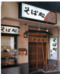
日本橋人形町2-26-9 TEL 03-3666-7656 営業時間 昼 11:00~15:00 夜 17:00~20:00 定休日 土曜・日曜・祝日