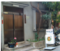
日本橋人形町1-7-2 TEL 03-3661-3956 営業時間 9:00~17:00 定休日 土曜・日曜 (土・日でも対応します)

自宅の鍵を作る鍵の仕事は、「信頼が大切」と語るご主人。 だからこそ久松防犯協会推薦の ご主人のもとには、安心して防 犯相談や鍵修理に訪れるお客様 が絶えない。