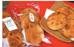
手焼き煎餅 (5枚) 500円 おこげ勘三郎焼き (5枚) 500円

落語家の桂三木助師匠が弟子達に食べられないように金庫に隠したという逸話もある「草加屋」の手焼き煎餅。甘酒横丁に面する店内では、所狭しと数十種類の煎餅が並び、ガラス越しにはご主人が煎餅を焼く姿を見ることがができる。朝5時半に炭をおこす作業から一日が始まり、その炭火の温度で40度以上にもなる小さな部屋の中で朝から夕方まで黙々と煎餅を焼き続ける。夏場などクーラーなんてあってないようなもの、まるで我慢比べ！一枚の煎餅に4分程かけながら、箸で丹念にひっくり返し、反り返らないようにコテで押さえる。頃合いをはかり、醤油につける。そうした丁寧な作業を繰り返し一日に、500枚の煎餅を焼き上げていく。また天気や温度・湿度にも細心の注意を払う。そんな苦労もあるが「常連さんはこの味をわざわざ買いに来てくれるから、先代から受け継いだ製法は変えずに、この味をずっと守り続けてい