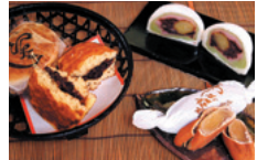
わしが在所 150円 五彩の餡のおまんじゅう 500円 とらやき 200円

人形町通りにある「人形焼本舗 板倉屋」の店内の一角にも楽しい和菓子が行儀よく並んでいる。「御菓子司 人形町 嘉野」の和菓子だ。