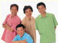
ザ・ワイルドワウンズ