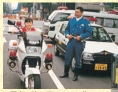
※写真は第15回てんてん祭

※大観音寺境内において、中央区社会福祉協議会「さわやかワーク中央」による、障害を持ちながらも自立や社会参加を目指している方々の自主製作品の展示販売を行います。（午後12時30分より）