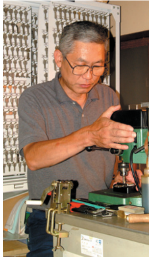
錠前交換・修理・スベアキー製作・ドアクローザー取付・ドア修理 ※備後も含めてご相談下さい。

特に最近是人形町でもマンション建設が多く、居住者にと っても防犯は大きな関心事という。2000年頃にピッキング グが大流行——「もともとはピッキングという技術は、鍵屋 の専門技術だったんですよ。それが中国の窃盗団がそれを覚