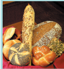
パン・ケーキ各種 79円より

ここタネネではライ麦の割合が低く、酸味が少ない南ドイツ地方のパンを買うことができる。外側はカリッと、中はフワリ柔らかくライ麦の香ばしさが楽しめる。一日に店頭に並ぶパンの種類は30〜40種類。その中でも、ひまわりの種入りブロードやカボチャの種つきセーレンなどが人