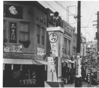
昭和7年、甘酒屋「尾張屋」

明治のはじめ頃の人形町通りは、まだ歩道もなく道幅もせまく、整備もされていない。じり道。だったそうです。両側には商家はあったものの、塗家や土蔵造りであったり、平家の木造建てで間口のせまい店々が並んでおり、チョット裏路に入れば、三軒五軒も並んだ長屋も建っていました。