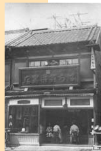
昭和初期の「ばち英」

「甘酒横丁」には、古くからの職人気質の商店が多いのも特長。そこで大正6年から約90年に渡り営業を続けている三味線屋の「ばち英」2代目ご主人に昔の通りの話を伺うことにした。 「この通りは、関東大震災後の区画整理で現在のようになっているができたんだよ。まあ私もその頃は生まれていた訳ではないがそれ以前は、もっともっと道幅も狭かったさうだよ。この店も震災や戦争によつて、もう3回ほど立て替えをしているよ」と教えてくれた。 ご主人が子どもの頃の「甘酒横丁」は、昼間は商人たちが行き交い、夕方になると料亭などへ向かう芸者衆で賑わっていた。今より人通りも多く、下町情緒が溢れていたと懐かしそうに話すご主人。芸事の盛んなこの町だからこそ「ばち英」は、当時から必要不可欠な存在だったのだろう。