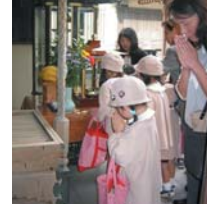
▲お釈迦様が安置された花御堂 お釈迦様に甘茶をそそぎお参りを している幼稚園児