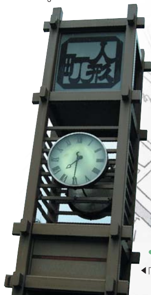
◀「人形町通り」のシンボルタワー