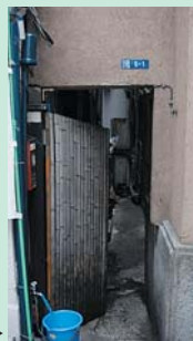
書籍の住所は「日山」の脇あたり▶

書籍「にほんばし人形町」によると「現在人形町2丁目5番と6番の間の1メートル余りの路地が、そのなごりといわれている」と書かれている。行ってみると、確かにドブ板が渡してあるような狭い道。お店の裏路地といった感じで、この通りを通ろうとする人はまずいないであろう。