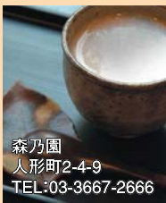
森乃園 人形町2-4-9 TEL:03-3667-2666