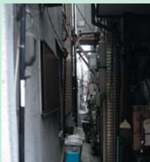
▲細い路地なので人通りは無い

書籍「にほんばし人形町」によると「現在人形町2丁目5番と6番の間の1メートル余りの路地が、そのなごりといわれている」と書かれている。行ってみると、確かにドブ板が渡してあるような狭い道。お店の裏路地といった感じで、この通りを通ろうとする人はまずいないであろう。