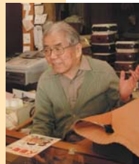
2代目ばち英のご主人