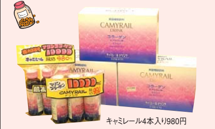
キャミレール4本入り980円

お買い得商品が店先にズラリと並び「ドラッグオゾン」は、人形町駅のすぐそばに位置することもあり、1日約800人の人が訪れる人気のドラッグストア。薬はもちろんのこと化粧品や洗剤などの日用雑貨の種類も豊富。その中で特にオススメなのが、美容補助飲料「キャミレール」。50mlの小さな小瓶の中にコラーゲンが10,000mg(10g)配合されており、これを飲めばお肌がツルツルに!味も夏ミカンのように、美味しいので、まとも買いする女性もいるほどの人気の商品。