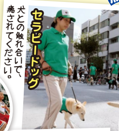
犬との触れ合いで、癒されてください。

当日は人形町大通りでマーチングバンドの行進やパトカー・白バイ・消防空中作業車・はしご車の展示、各地産直品の販売、手作りゲームなど、楽しいイベントが盛りだくさん!