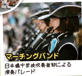
マーチングバンド 日本橋中学校吹奏楽部による演奏パレード