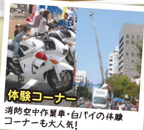
体験コーナー 消防空中作業車・白バイの体験コーナーも大人気!