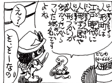
人形町は奥が深いのだ by SANGO MORIMOTO © 2013