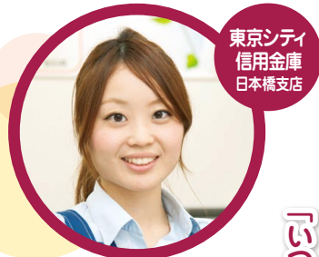
東京シテイ 信用金庫 日本橋支店