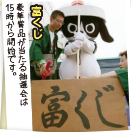
豪華賞品が当たる抽選会は、15時から開始です。