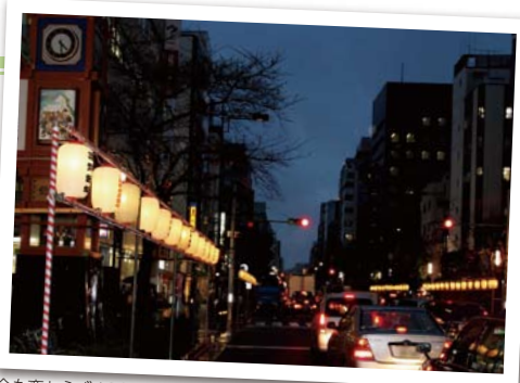
今も変わらず人形町通りの歳末装飾は、「提灯イルミネーション」

石井 そういえば、昔は和装小物を買うなら銀座より人形町と言っていましたね。それだけ、人形町には専門店が多かったです。だからこそ、銀座よりハイカラな町であり、洋食屋が多かったということなのかもしれません。