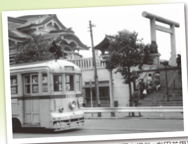
路面電車／昭和44年頃