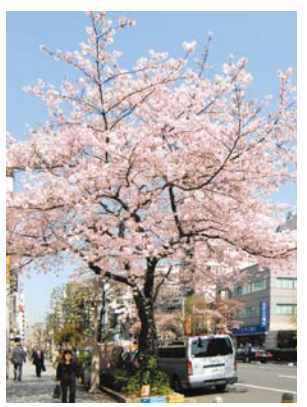
人形町通りの桜並木