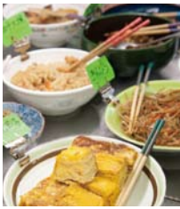
ガラスケースの中には手作り惣菜が並ぶ。