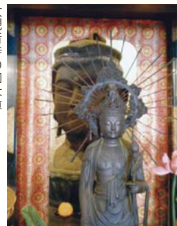
大観音寺の御本尊

明治元年、廃仏毀釈運動の蛮行が各地で繰り返される中、鶴岡八幡宮の所有と誤解され破却されそうになるという危ういところを二人の人物が船で搬出し深川御船蔵前の河岸に陸揚げされ、その後現在の大観音寺に