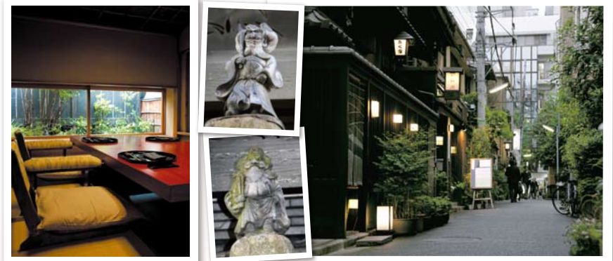
「きく家」「新参者」の舞台となった部屋