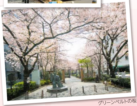
グリーンベルトの桜