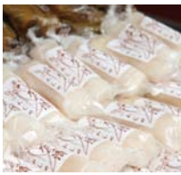
これぞ名物、「べつたら漬け」