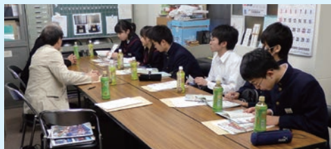
事務所で皆でディスカッション