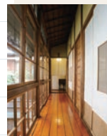
美しい波形ガラスの廊下

は、2002(平成14)年に登録有形文化財に指定。しつとりと落ち着いた座敷から眺める坪庭もまた風流。昭和初期の和風住宅で名物ねぎま鍋を味わえるのも、人形町ならではの贅沢と言えよう。