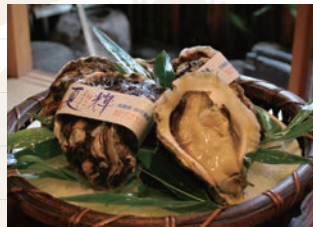
女将さんの故郷である鳥取県から毎日届く新鮮な魚介類の数々

人形町1-5-14 TEL: 03-3662-0163 営業時間: 月~土曜(昼)11:00~13:30 月~金曜(夜)17:00~22:00 定休日: 土曜・日曜・祝日