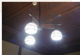
美しいデザインのレトロな照明

座敷へと向かう。そもそもこの建物は複数の家屋で構成されている。そこは街の喧騒とは違い、まるで古い旅館の佇まいのようだ。右手には、太い絞丸太柱に床の間がある大広間が見える。天井は一枚板の総檜、趣きある照明、美しい立体の欄間や雪を眺めるための雪見障子が印象的な「雪の間」。一つが今の職人では到底できない技であつらえられている。それぞれに趣向の違う11の個室は、十字の赤い絨毯の廊下で繋がれているのだ。日本家屋ならではの贅沢な空間で、こだわりのすき焼きを味わってみよう。