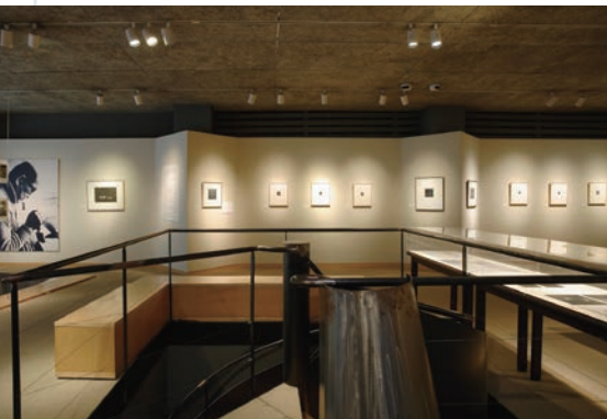
やさしい照明の中、ゆつくり作品を鑑賞できる。

濱口陽三の父・儀兵衛は南画収集家で、自らも南画を学んだ人であり、さかばれば、5代目濱口灌圃は江戸後期に活躍した南画家だった。濱口家は芸術に秀でた人物を多く輩出した家柄でもある。陽三は、カラーメゾチントという独特の銅版画技法を開拓し、その卓越した技術が創り出す静謐な世界は、今も多くのファンを魅了している。作品と向かい合ったあとは、併設のカフェでゆつくり過ごすのもいいだろう。ヤマサ醤油株式会社黒蜜風しょうゆをパニラに混ぜ込んだ「マーブル醤油アイスクリーム」を味わえるのも、またこの美術館の魅力だ。