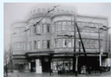
旧久留米屋総本店ビル

二つのビルの間を三ノ輪へ行く21番、渋谷へ向かう9番、土州橋から北千住までの22番、後楽園を通つて角筈までの14番とそれぞれ番号をつけた都電が走る、これが人形町の日常の風景だったので。