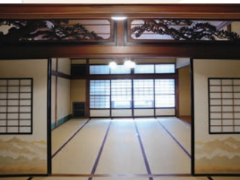
美しい立体の欄間や雪見障子のある「雪の間」