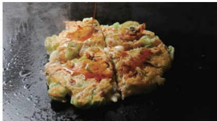
「松浪焼き」は看板メニューだ。浅網、天カス、長葱の具材を混ぜた生地に秘伝の配合で味付け。

人形町2-25-6 TEL: 03-3666-7773 営業時間: (昼)月・火・木11:30~なくなり次第 (夜)17:00~22:00 定休日: 日曜・祝日