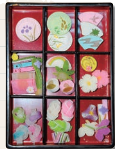
季節のカラフルな干菓子が可愛らしい。