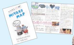
宮古を紹介した手作りパンフ