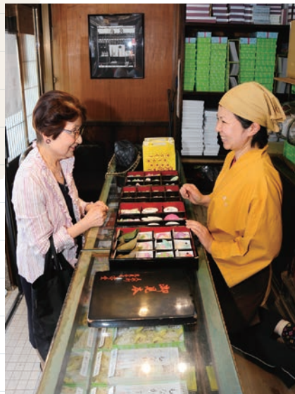
きちんと「座売りスタイル」でお客様に対応。

ショーウィンドーには干菓子が、塗箱の中にきれいに並んでいる。季節によって変わる掛け紙(パッケージ)も人気だ。店頭では名代「黄金芋」のニッキ独特の香りも漂っている。