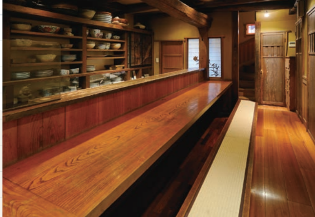
木の温もりが感じられる店内

しいと、そのままの形で人形町の地に移築された建物がある。それが日本料理店「十四郎」として生まれ変わった。店内には、昔ながらの梁、欄間、床などが使われている。太い柱の所々には、釘を使わない本物の木造軸組み工法の跡が間近に見える。