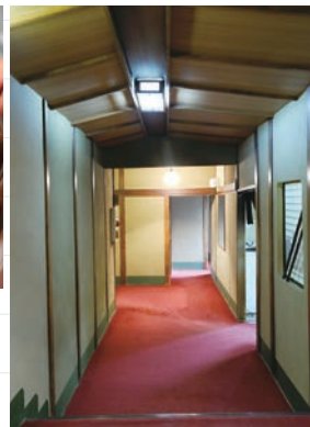
ふかふかの赤い絨毯の廊下

人形町2-5-1 TEL: 03-3666-2901 営業時間: 月~土曜 11:30~14:00 17:00~21:00 定休日: 日曜・祝日