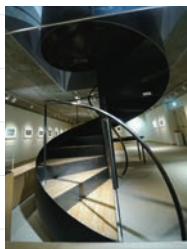
螺旋階段は、当時の倉庫で使用されていた、荷物の上げ下ろし場であった。

歴史あるヤマサ醤油10代目の濱口儀兵衛の三男である、濱口陽三の作品を収蔵展示している美術館。ここは、元々はヤマ