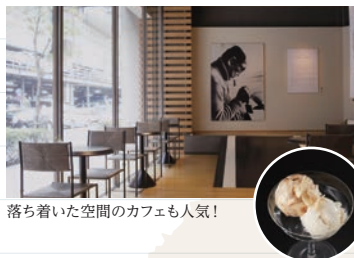
落ち着いた空間のカフェも人気!