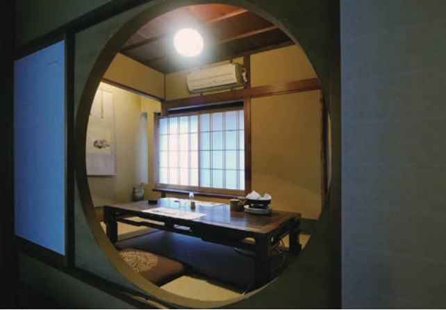
丸窓を配置した「柳の間」

座敷へと向かう。そもそもこの建物は複数の家屋で構成されている。そこは街の喧騒とは違い、まるで古い旅館の佇まいのようだ。右手には、太い絞丸太柱に床の間がある大広間が見える。天井は一枚板の総檜、趣きある照明、美しい立体の欄間や雪を眺めるための雪見障子が印象的な「雪の間」。一つが今の職人では到底できない技であつらえられている。それぞれに趣向の違う11の個室は、十字の赤い絨毯の廊下で繋がれているのだ。日本家屋ならではの贅沢な空間で、こだわりのすき焼きを味わってみよう。