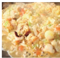
「江戸もんjya」のバリエアもんじゃ

「玉ひで」姉妹店としての「江戸路」。人の厳しい目や味の質、商いに、彼女は細心の注意を払う。だからなのか、味にうるさい人形町の人も認知され、お店はいつも満席だ。她才ある彼女は、3年ほど前から、「江戸路」の隣でタイレストラン「ワンちゃん」をスタートさせた。本場の味が味わえ