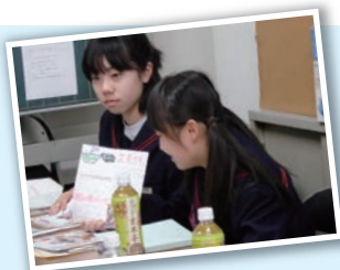
組合事務所でプレゼン中!

後日、組合や店舗に「親切な対応ありがとうございました。この経験を郷土の復興と振興のために貢献して行きたい。購入したお土産も家族に喜ばれました」というお礼状が届きました。東日本大震災から4年が過ぎていまだに余震があるなか、それでも若い力が負けずに頑張っている姿が垣間見られた。