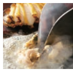
「江戸もんjya」のアワビの白ワイン蒸し

ると、これもランチもディナーも人でいっぱいだ。「たまたま「江戸路」で働いてくれたタイ人の彼女がいて、一緒にタイ料理の勉強もしました。彼女がいなければタイレストランをやつていなかったと思いますよ」と語る。さらには昨年7月「ワンちゃん」の上で、彼女の念願であった「江戸もんjya」を開店。イタリアンや中華などのテイストを取り入れた新感覚のもんじゃだ。もんじゃと共に鉄板焼きも楽しめ、連日大賑わい。そんな忙しい彼女に、商いの秘訣とは何かを尋ねると、「商いは本当に好きでなければできない。でも何より私の人生において重要なことは、人との出会いです。二人に出会わなければ今の私はなかったかもしれませんね」と笑顔で話してくれた。