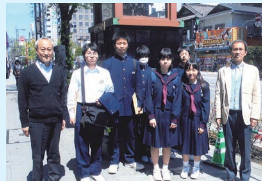
からくり櫓の前に記念撮影

平成27年4月15日、宮古市立河南中学校の修学旅行別班スケジュールとして中学3年生6名が、職場訪問学習として人形町商店街協同組合を訪問。坂