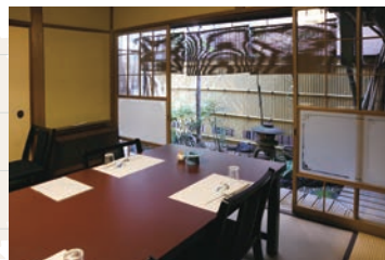
中庭が見える個室。テーブルにイス席のお部屋は海外のお客様にも好評！

往年の花街を偲ばせる情緒ある通りに店を構える「よし梅芳町亭」。震災復興期に建てられた木造総二階建のこの建物は、芳町が花柳界として全盛であった頃の待合として、さらには芸者から転身した女優・花柳小菊の私邸でもあった数奇屋造りの一軒家だ。店内に入ると、屋久杉を使った天井、波形ガラスの廊下、銘木の床柱など、随所に贅沢な意匠が凝らされ