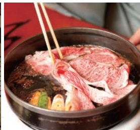
仲居さんの見事な手さばきで1枚ずつ丁寧にすき焼きを炊く。すきやきコース:9,720円~