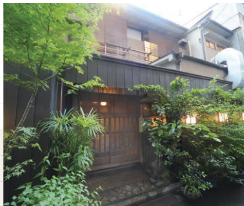
登録有形文化財建造物

人形町1-5-2 TEL: 03-5623-4422 営業時間: 17:00~22:00 定休日: 土曜・日曜・祝日