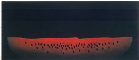
「西瓜」/濱口陽三 1981年 カラーメゾチント 23.3×54.1cm