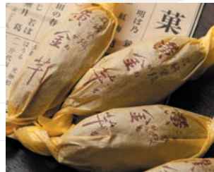
焼き芋そっくりの「黄金芋」/1個200円

会期:2015年7月18日(土)~9月23日(祝・水) ※詳細はお電話かHPにてご確認ください。 http://www.yamasa.com/musee